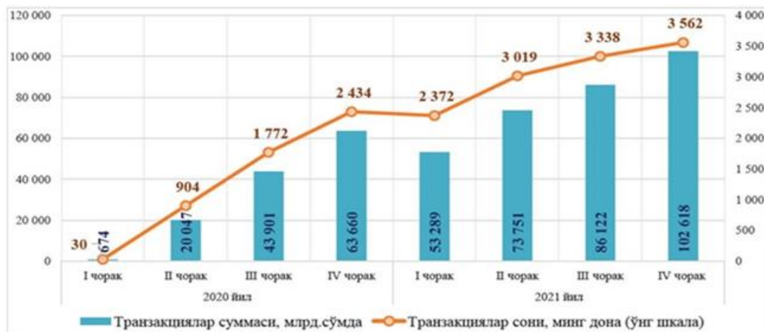
1-расм. Марказий банк Тезкор тўловлар тизимида амалга оширилган транзакциялар тўғрисида маълумот [9]

Бугунги кунда республикадаги барча тижорат банклари Тезкор тўловлар тизимига уланган бўлиб, масофавий хизмат кўрсатиш тизимлари орқали ишлаётган барча мижозларга ушбу янги тизимдан фойдаланиш имконияти тўлиқ яратилган.